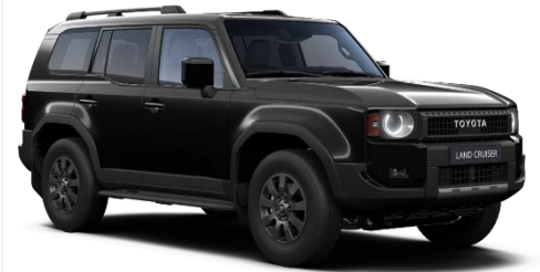
Aura Black 690 €