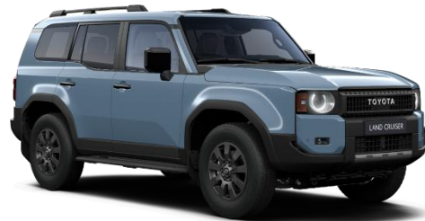
Smoky Blue 300 €