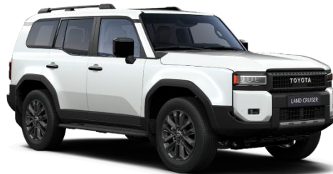
Platinum Pearl White 990 €