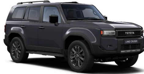
Dark Grey 0 €