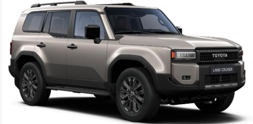
Avant Garde Bronze 690 €