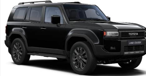
Aura Black 690 €