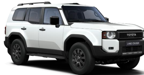
Platinum Pearl White 990 €