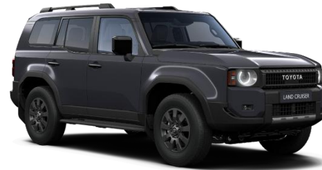
Dark Grey 0 €