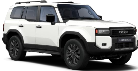
Pure White 0 €