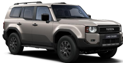
Avant Garde Bronze 690 €