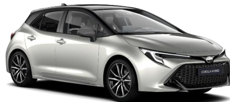
Bi-tone Precious Silver 850 €