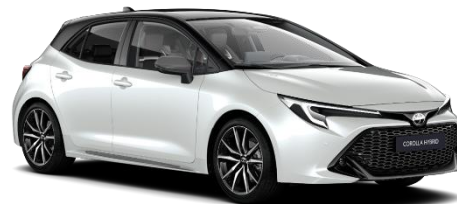
Bi-tone Platinum Pearl White 850 €