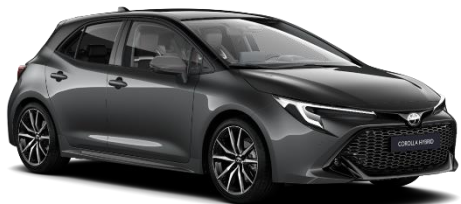
Bi-tone Storm Grey 560 €