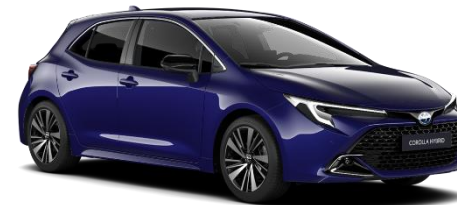
Juniper Blue 560 €