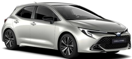
Precious Silver 850 €