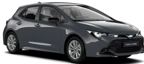
Storm Grey 560 €