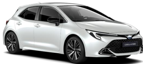
Precious Silver 850 €