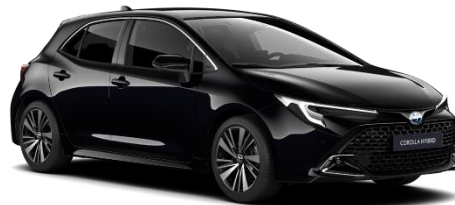
Night Sky Black 560 €