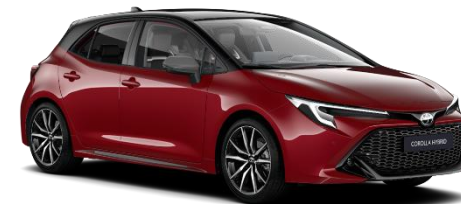
Bi-tone Emotional Red2 850 €