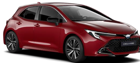
Emotional Red2 850 €