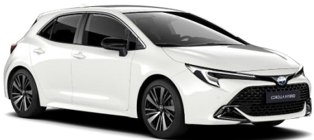
Pure White 0 €