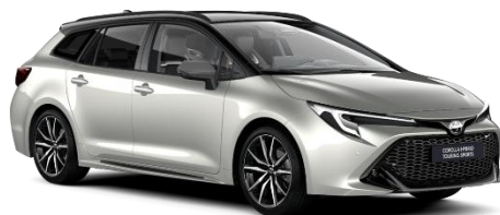
Bi-tone Precious Silver 850 €