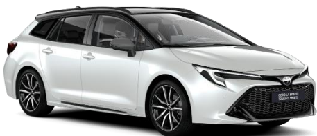
Bi-tone Platinum Pearl White 850 €