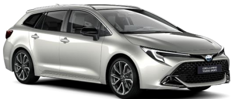
Precious Silver 850 €