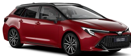
Bi-tone Emotional Red2 850 €