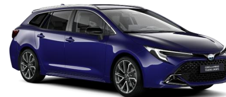
Juniper Blue 560 €