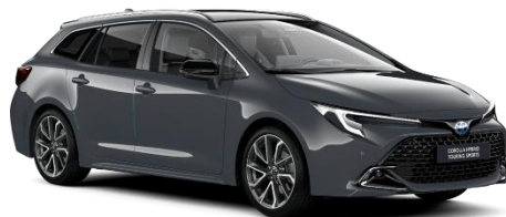
Storm Grey 560 €