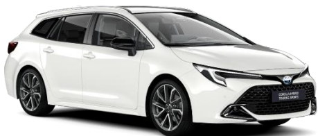
Pure White 0 €