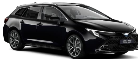
Night Sky Black 560 €