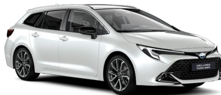
Platinum Pearl White 850 €