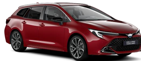
Emotional Red2 850 €