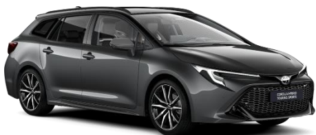
Bi-tone Storm Grey 560 €