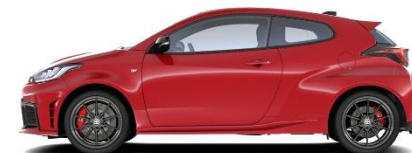
Emotional Red2 700 €