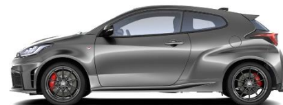
Precious Metal 700 €