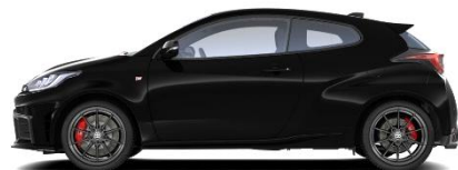
Magnetic Black 470 €