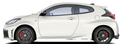
Platinum Pearl White 700 €