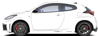
Pure White 0 €